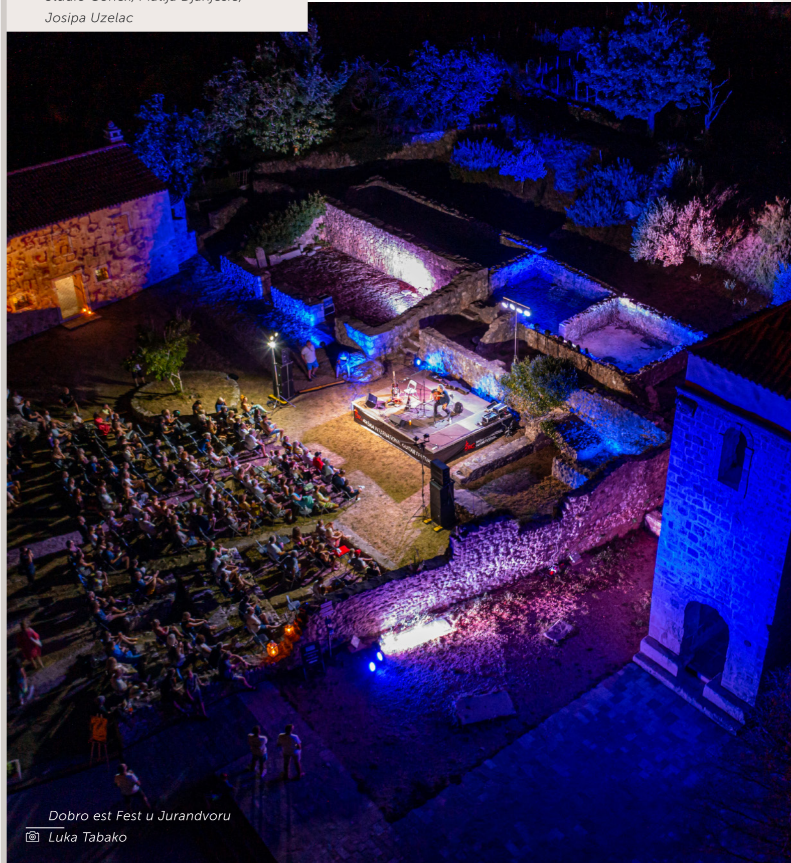
Dobro est Fest u Jurandvoru