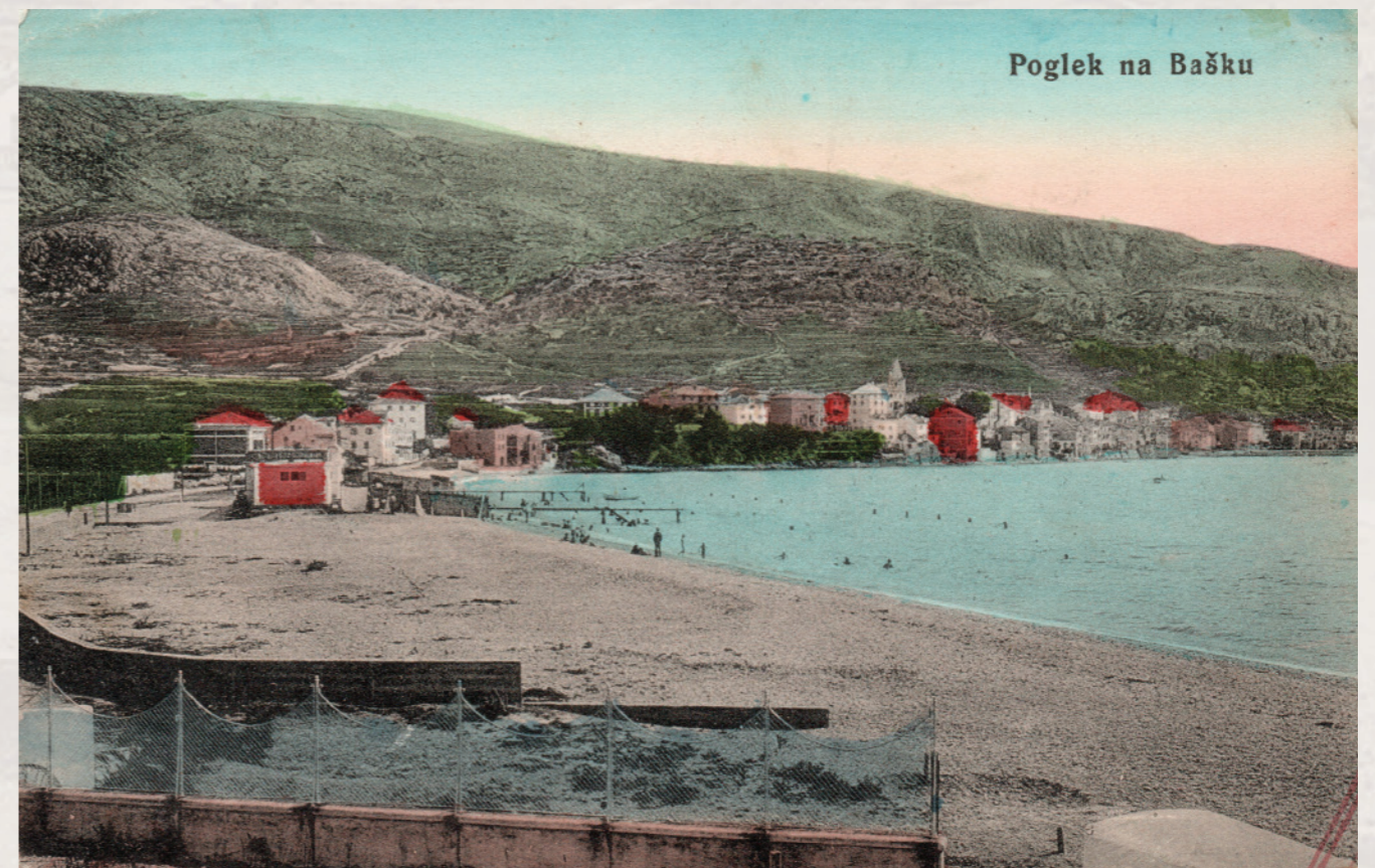
Pogled na kupalište | Razglednica putovala 1913. u Moravsku | Naklada: Barbalić i M. P. Dorčić