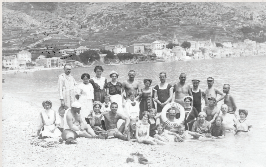
Otvorenje kupališta | Razglednica putovala 6. 8. 1909. u Zagreb