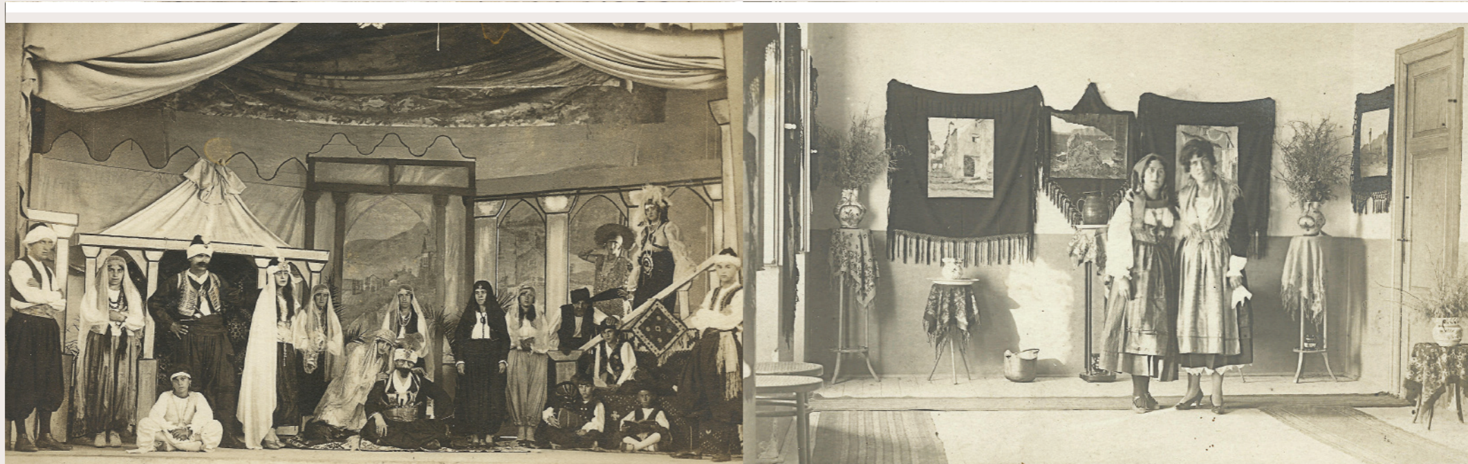
Hasanaginica na pozornici Narodnog doma

Pod okriljem Čitaonice osnovano je 1911. godine Glazbeno društvo Zvonimir , a četiri godine kasnije kapelan Josip Jadrošić Lošinjanin potrudio se da u Građanskoj školi pronađe dovoljno glazbeno nadarenih učenica i učenika kako bi osnovao Tamburaški zbor . Narodni duh neprestano je rastao zaslugom Čitaonice