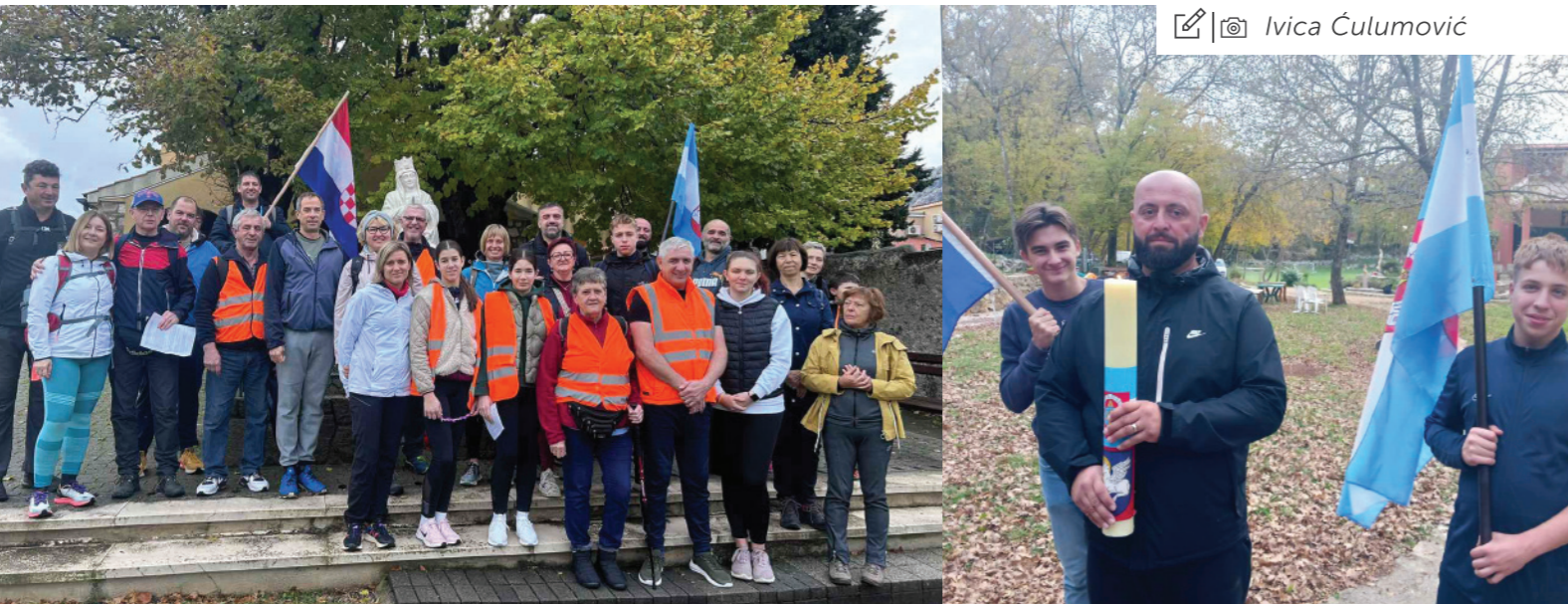
✍️📷 Ivica Čulumović

Zajedno s kolonom sjećanja koja je krenula u Vukovaru i Škabrnji u čast žrtvama, krenula je 12. godinu zaredom i skupina hodočasnika iz Baške prema Krku (Svetište Majke Božje Goričke - Oaza Kraljice mira) da bi skromnom žrtvom odalo počast stradanju hrvatskog naroda.