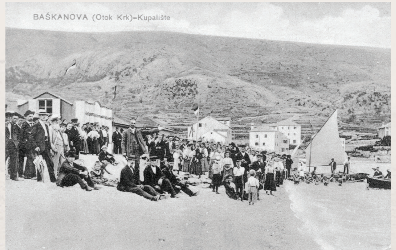
Dolazak sve većeg broja gostiju | Razglednica putovala 1912. u Gradec