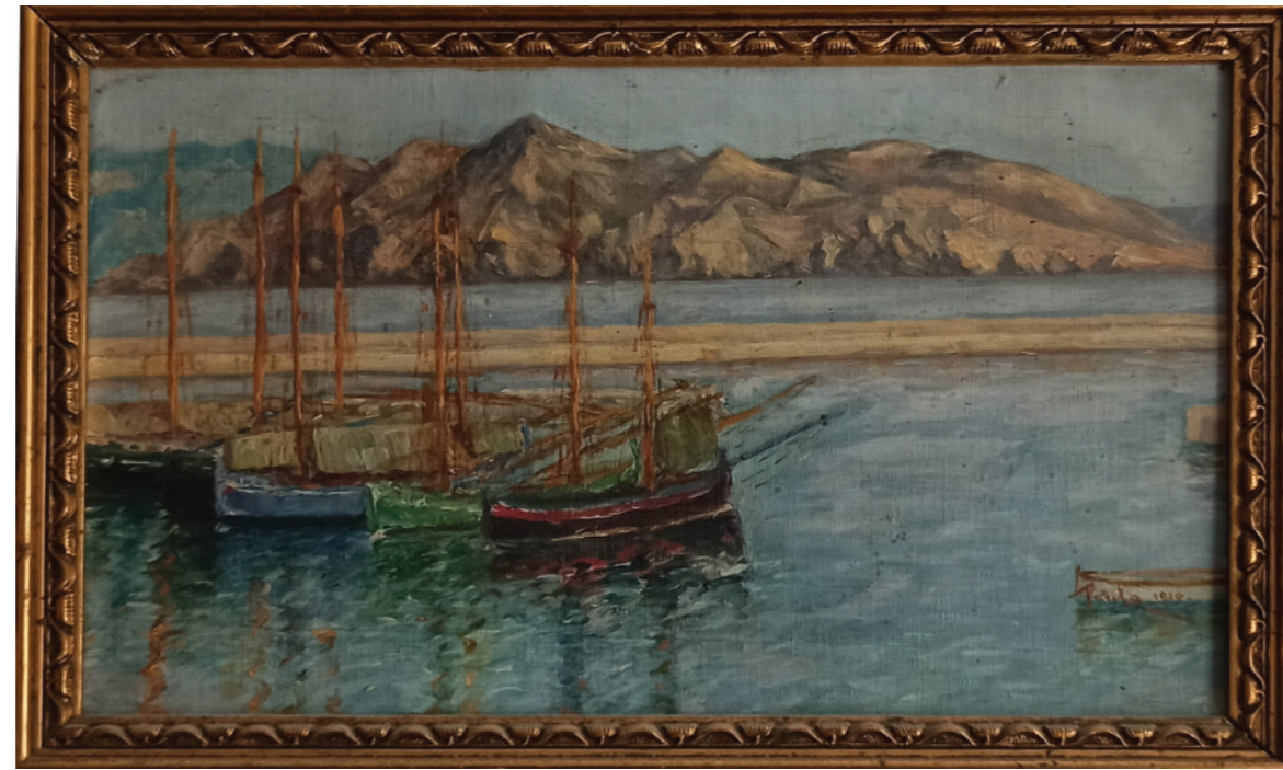
Baška - Prvić