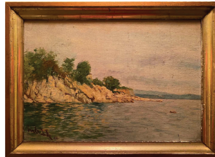
Baška - Kricin

djevojačku školu. Glasovir i pjevanje isprva je učila privatno, ali nije poznato kod kojih pedagoga. Nakon toga je polazila privatnu glazbenu školu profesora