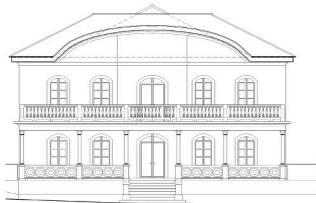
Rekonstrukcija Doma kulture

Pored ova dva velika projekta planiran je i početak investicije koja uključuje rekonstrukciju kanalizacije Stari dvori, izgradnja mini kružnog raskrižja u Ulici kralja Zvonimira na raskrižju s Ulicom Šantis i Put Zablaca, zatim se planira i nastavak aktivnosti radi realizacije projekta izgradnje zaobilaznice Drage Baščanske