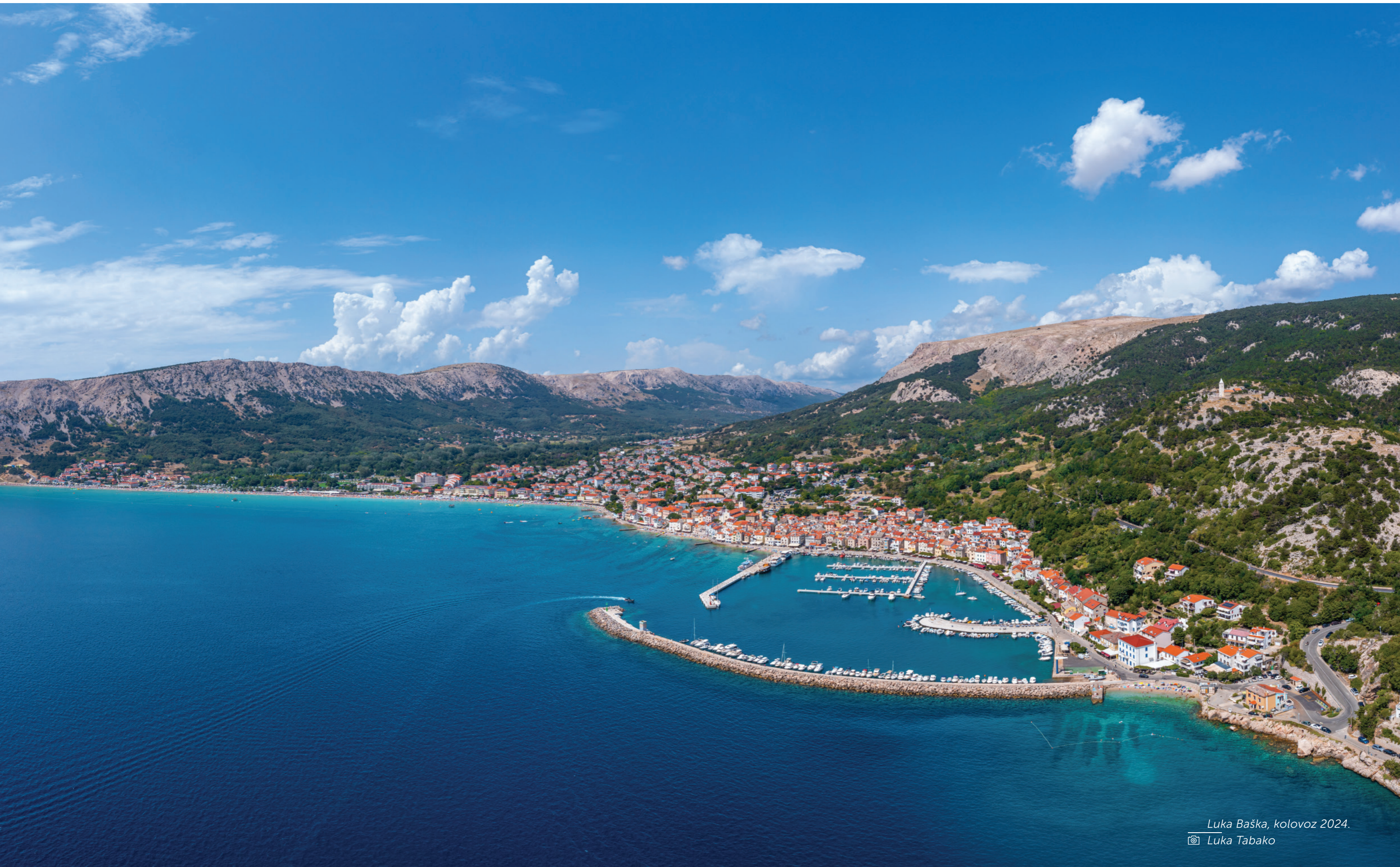
Luka Baška, kolovoz 2024.