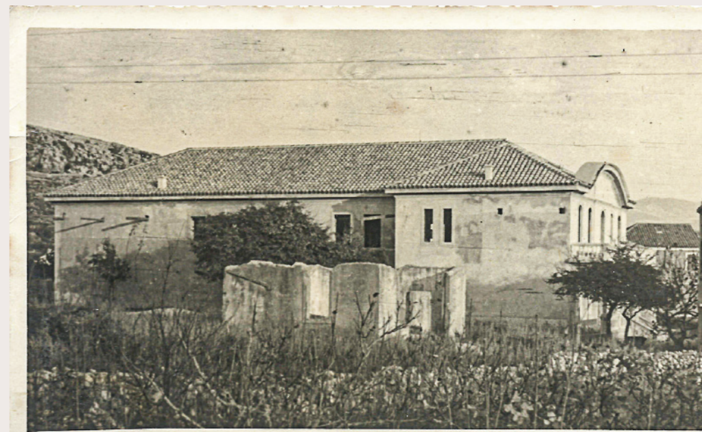
Narodni dom u Baški nakon Drugog svjetskog rata